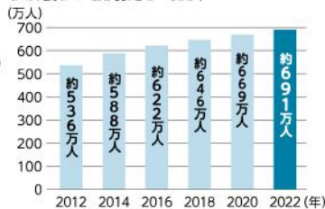
(要介護(要支援)認定者の推移)

脳卒中や転倒・骨折等をきっかけに要介護状態になる高齢者は多く、「親の介護は突然やってくる」といえます。親の介護が必要になったときに「介護を理由に仕事を辞めない」ためには、あらかじめ経済的な備えをしておくことが重要です。